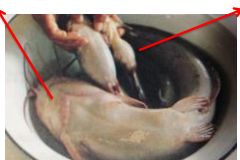
อายุ 1 ปี น้ำหนักมากกว่า 5 กิโล