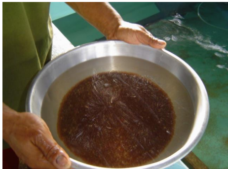
ไซที่ล้างสะอาดพร้อมที่จะนำลงฟักบดตะแกรง