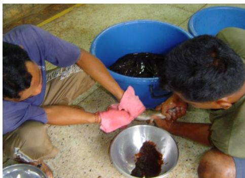
รีดไข่แม่ปลา