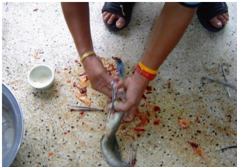
ผ่าท้องปลารูปปลาเอาถุงน้ำเชื้อ