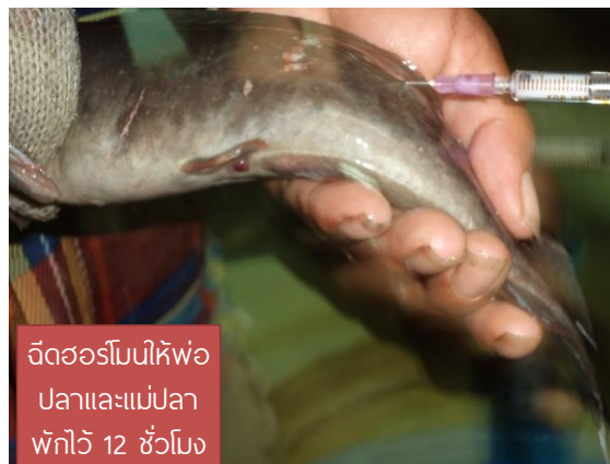
ฉีดฮอร์โมนให้พ่อปลาและแม่ปลา ฟักไข่ 12 ชั่วโมง