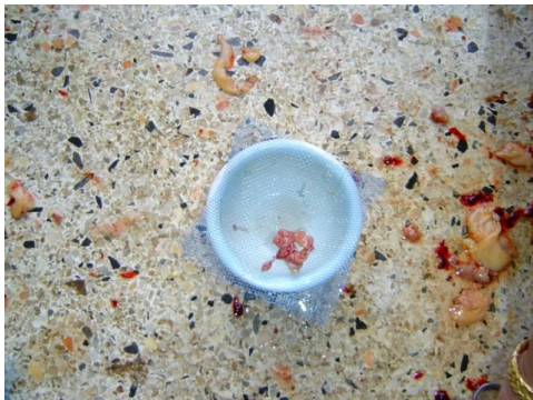
ตัดถุงน้ำเชื้อใส่ผ้ามุ้งเขียว