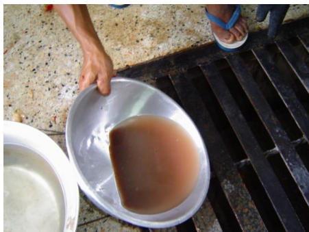
ล้างไขด้วยน้ำให้สะอาด