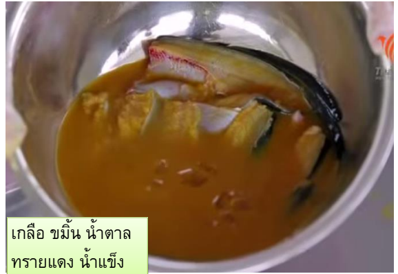
เกลือ ขมิ้น น้ำตาล ทรายแดง น้ำแข็ง