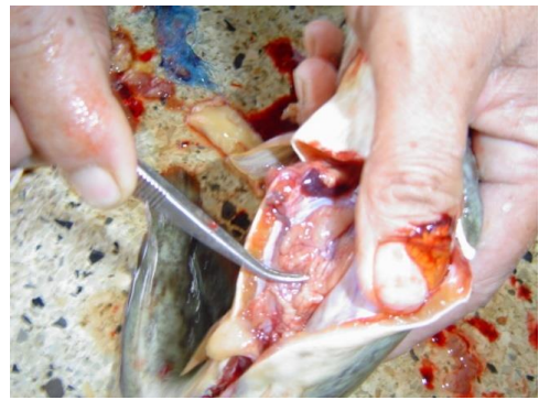
น้ำเชื้อเพศผู้ที่ดี ต้องมีสีขาวขุ่น ทั้ง 2 ด้าน