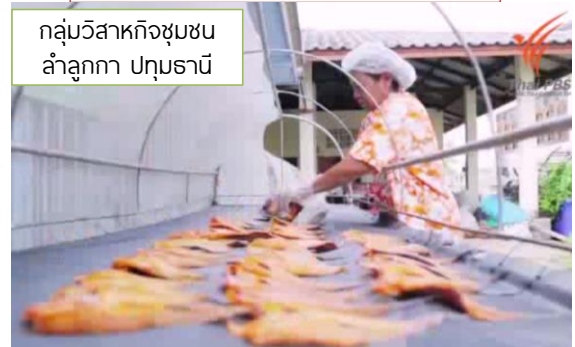
กลุ่มวิสาหกิจชุมชน ลำลูกกา ปทุมธานี