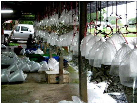
แหล่งพันธุ์