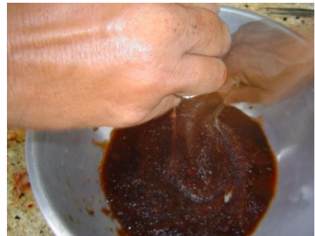
บีบถุงน้ำเชื้อใส่ในไขปลาตุกที่รีดไว้