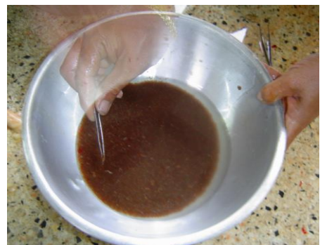
เก็บเศษไขมันและสิ่งปนเปื้อนออกจากไข